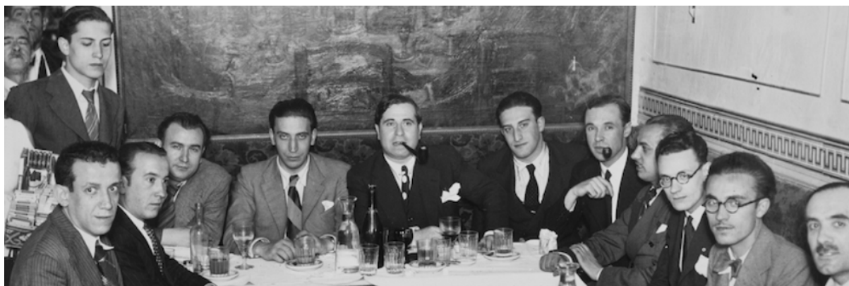
Tertulia literaria de Ramón Gómez de la Serna en el Café Pombo