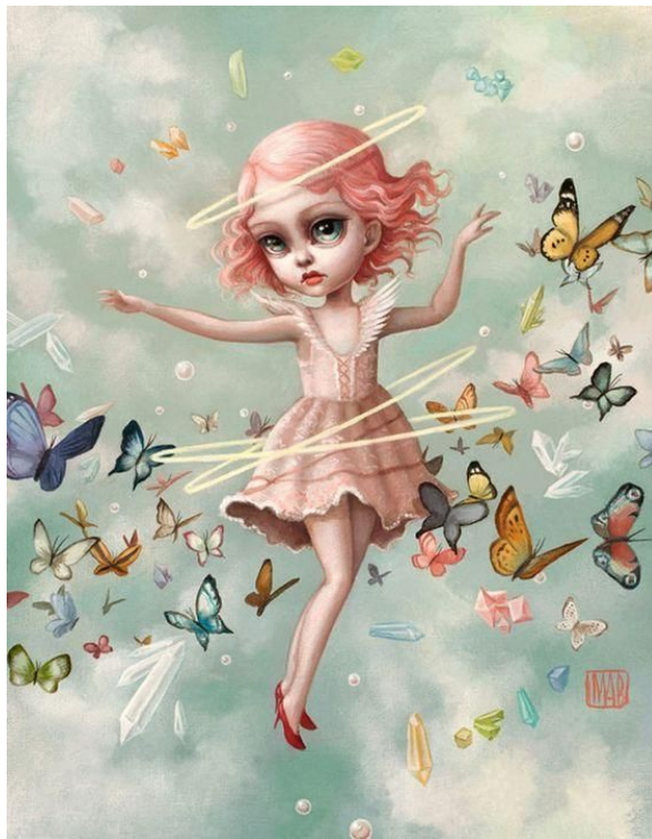
'The Dream', ilustración de Mab Graves

Valeria era una niña como otra cualquiera pero con una imaginación desbordante. Una vez dejó uno de sus dientes de leche debajo de la almohada, como había hecho en otras ocasiones, para que el ratoncito le trajera un regalo a cambio del diente, pero algo sucedió que el ratón no llegó y el diente ahí quedó. Sin embargo, tuvo un extrañísimo sueño.